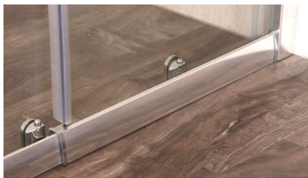
Mascherine in ABS cromate