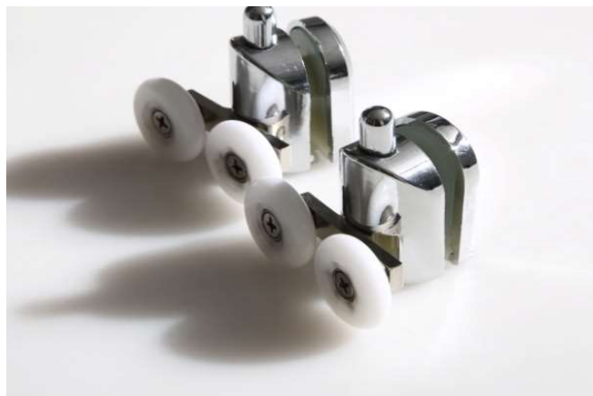
Cuscinetti doppi inferiori supporto in ABS cromato pulsante per lo sganciamento antina