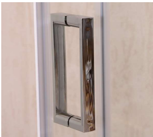
Maniglia in ABS cromata

100/110 : 110/120 : 120/130 : 130/140 H 1900 mm